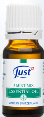
ETERIČNO ULJE NANE Sinergija nane za osvežavanje i bolju koncentraciju. 10 ml - Art. 3850