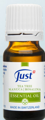
ETERIČNO ULJE TEA TREE Formula sa izuzetno umirujućim i pročišćavajućim svojstvima. 10 ml - Art. 3816