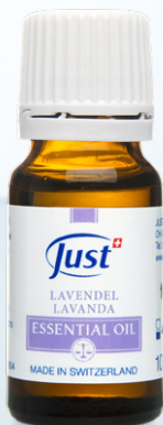
ETERIČNO ULJE LAVANDE Sugestivne mirisne note koje prizivaju mir i spokoj. 10 ml - Art. 3804