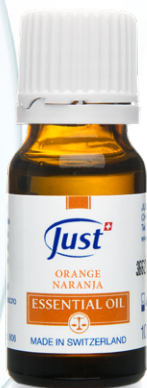
ETERIČNO ULJE POMORANDŽE Slatka nežnost i pozitivnost inspirisana plodovima Mediterana. 10 ml - Art. 3806