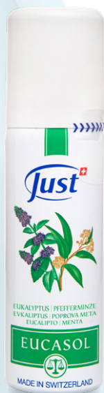
EUCASOL Prepoznatljiv sprej sa eteričnim uljima za intenzivno osvežavajuće i umirujuće blagostanje. Sadrži eukaliptus, bor i nanu. 50 ml - Art. 3580

Eucasol , sa neponovljivom balzamičnom snagom, za uživanje u dubokom udisanju.