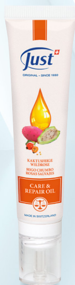
ULJE ZA NEGU I REGENERACIJU Kozmetički efekat „nove kože“ za područja koja su pogođena strijama ili ožiljcima. Sadrži indijsku smokvu, crnu ribizlu i kardiospermum. 40 ml - Art. 3462