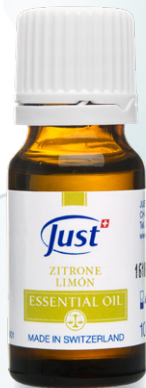
ETERIČNO ULJE LIMUNA Osvežavajuće note i energizirajuća svojstva. 10 ml - Art. 3801